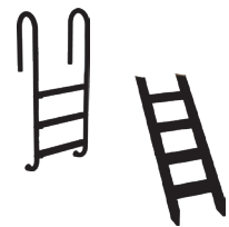
Échelle & Escalier (en option)